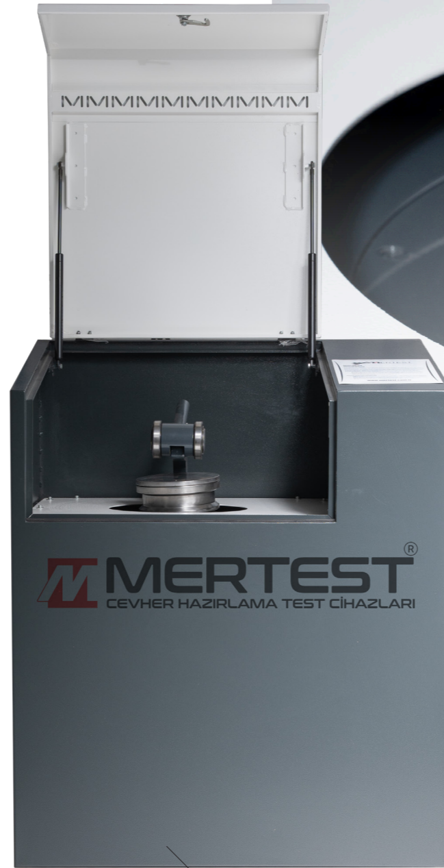
Öğütme Ünitesi Grinding Unit

*The Grinding Unit is mounted on a monoblock chassis. In sessions with severe vibration, vibration and sound were minimized.