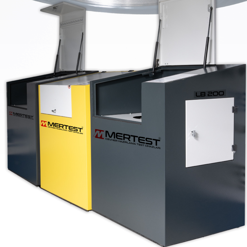
Öğütme Kabi Grinding