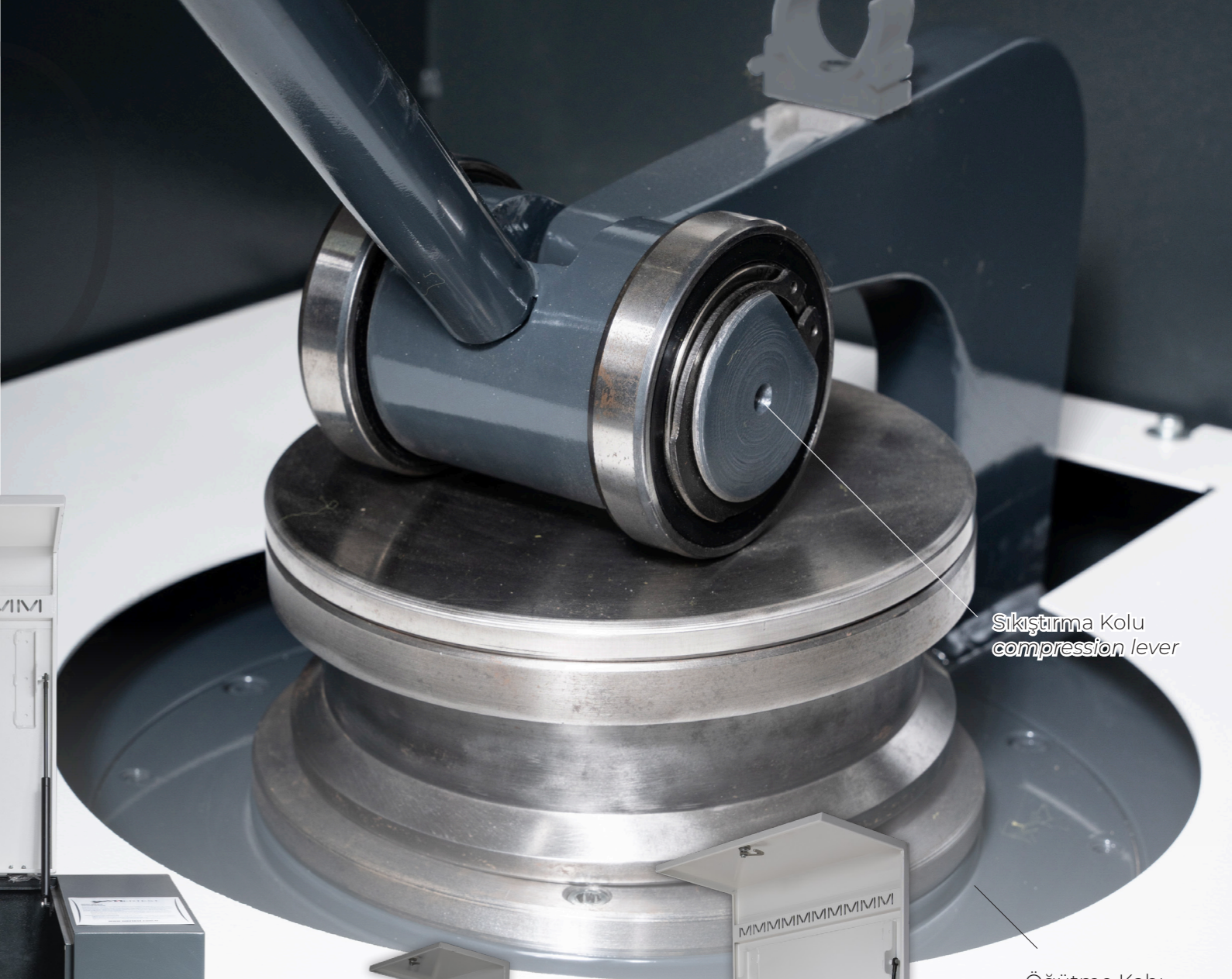
Sıkıştırma Kolu compression lever